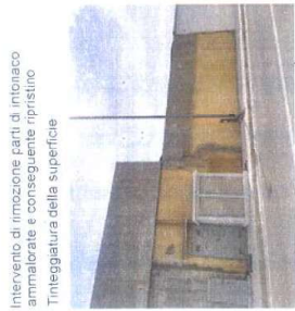
Intervento di rimozione parti di intonaco ammalorate e conseguente ripristino Tineggiatura della superficie