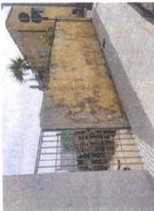
Rimozione cancelletto pedonale provvisorio e chiusura del foro presente Intervento di rimozione parti di intonaco ammalorate e conseguente ripristino Tineggiatura della superficie