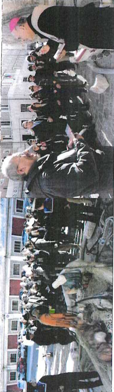
Inaugurazione Natività 2017 - Immagini sulle presenze previste