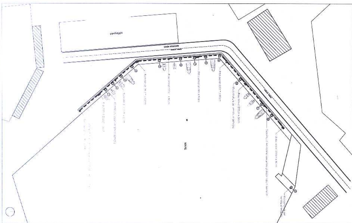
PLANIMETRIA PROGETTO, scala 1:500